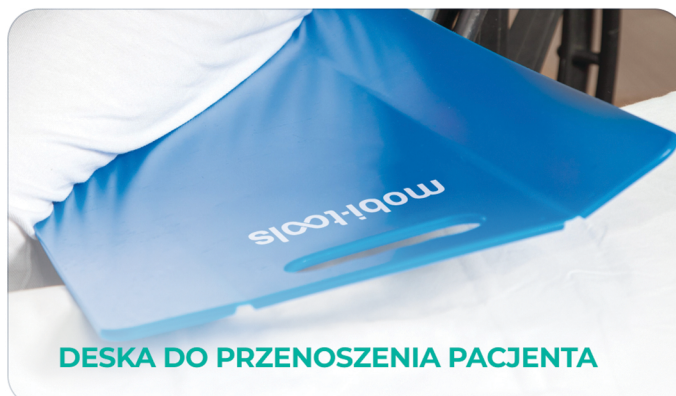
DESKA DO PRZENOSZENIA PACJENTA