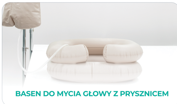
BASEN DO MYCIA GŁOWY Z PRYSZNICEM