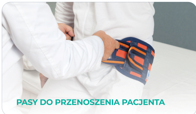
PASY DO PRZENOSZENIA PACJENTA